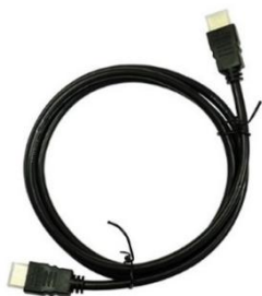
モニター用接続ケーブル